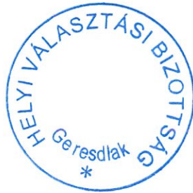
Weintraut Antalné HVB elnök-helyettes