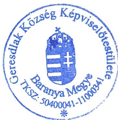
Dr. Habjánecz Tibor polgármester

Dr. Habjánecz Tibor polgármester megállapította, hogy a napirend maradéktalanul megtárgyalásra került, több kérdés, hozzászólás nem lévén 13.45 órakor a testületi ülést berekesztette.